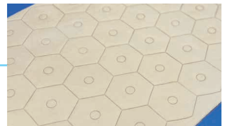
3 Con los donuts hexagonales se minimizan los recortes de masa