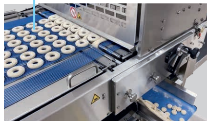
4 Retirada automática de los recortes de masa