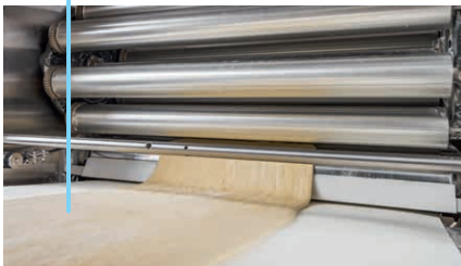
2 Banda de masa sin tensiones