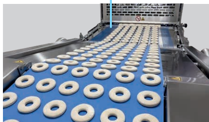
5 Depositado seguro de las piezas de masa en la cámara de fermentación