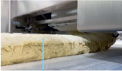
1 Banda de masa uniforme