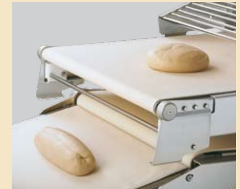
Dadurch immer ein perfekt, grader Schluss für beste Brotqualität!