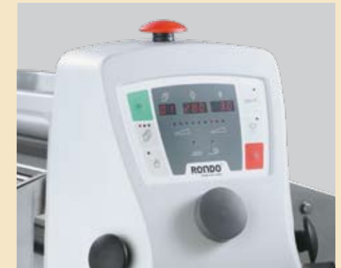
30 Programmspeicher zum automatischen Ausrollen, 20 Speicher zum Wirken von Teigen.

Herstellen von tourierten und untourierten Produkten in hoher Qualität