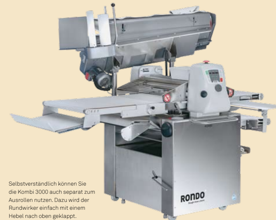
Selbstverständlich können Sie die Kombi 3000 auch separat zum Ausrollen nutzen. Dazu wird der Rundwirker einfach mit einem Hebel nach oben geklappt.