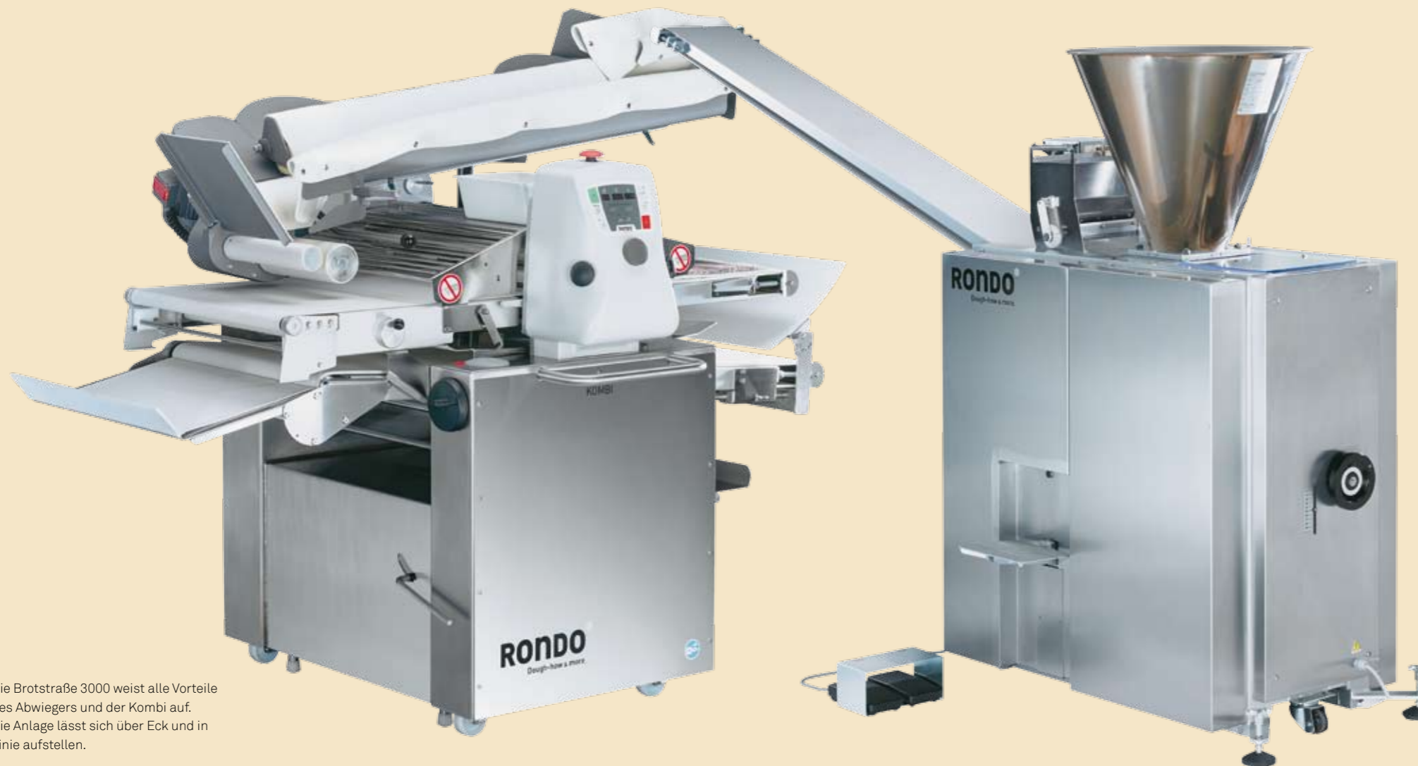
Die Brotstraße 3000 weist alle Vorteile des Abwiegers und der Kombi auf. Die Anlage lässt sich über Eck und in Linie aufstellen.