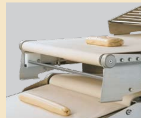
Herstellung von Baguettestangen, Mini-Baguette, Schrippen & mehr.

Herstellen von tourierten und untourierten Produkten in hoher Qualität