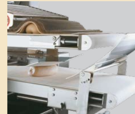
Das Teigstück wird im ersten Schritt mit einer Schleppe eingeschlagen und im zweiten Schritt in entgegengesetzter Richtung mit Hilfe der verstellbaren Druckplatte langgewirkt.