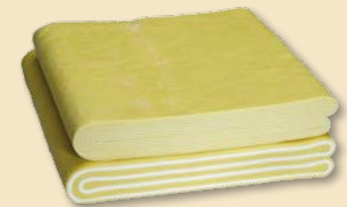
Automatisches und manuelles Tourieren von Plunder-, Croissant- und Blätterteig.