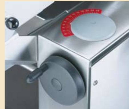
Die Wirkdruckplatte wird über ein leicht zugängliches Handrad auf den im Programm hinterlegten Wert eingestellt.

Die komplette Brotstraße aus Abwieger 3000 und Kombi 3000 mit Rundwirker ermöglicht Ihnen eine vollautomatische Brotherstellung auf engstem Raum.