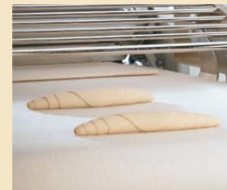
Mit einem optionalen Hörnchenwickelgerät lassen sich auch Hefehörnchen, Salzstangen, Kornspitz und Laugenstangen aufarbeiten.